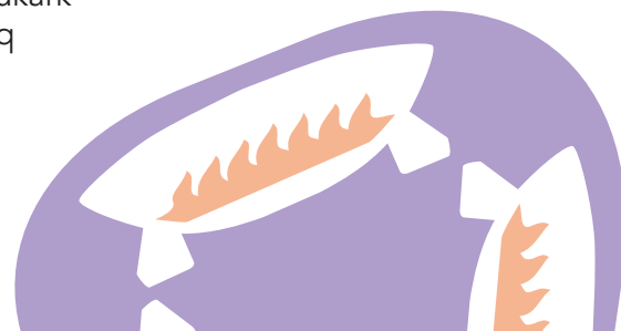
Amber Aglukark Angirjuqaaq